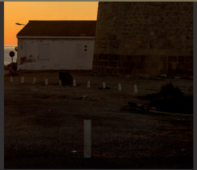
El Campello, Alicante